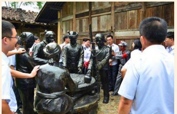
(随身携带草鞋绳的村民)