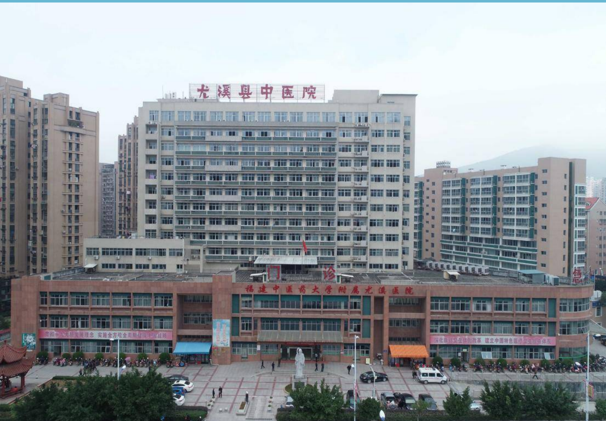
图为我司施工的尤溪县中医院综合楼（省级文明工地）