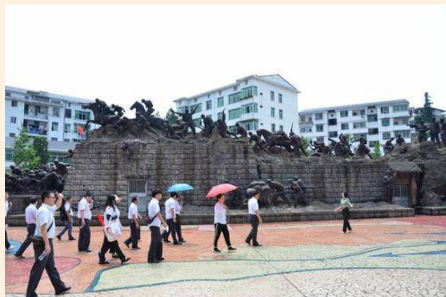
（反“围剿”大型铜雕群）