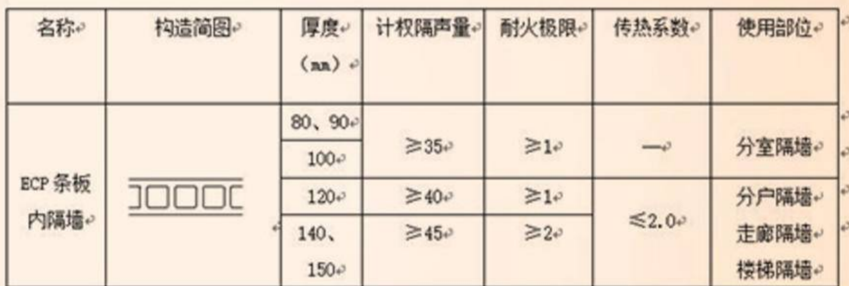
ECP条板内隔墙主要技术性能

民用建筑要求围护结构与主体结构可靠连接和具有抗震性能，墙体宜选用强度高、质地轻、隔声、保温隔热、防水防火等综合性高的板材。ECP墙板完全满足上述要求，具体性能指标如下：