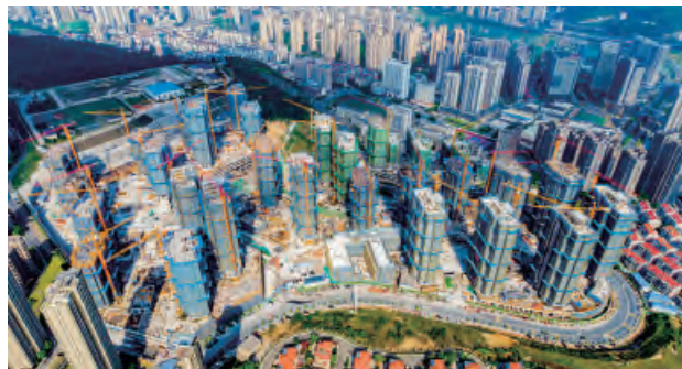
三明徐碧“城中村”棚户区改造项目

近日，福建省发展和改革委员会公布了 2023 年度省重点项目名单，集团共有 8 个项目在列，其中承建的三明市外项目有 4 个，承建的三明市区项目有 4 个，总合同额达 30 亿元。