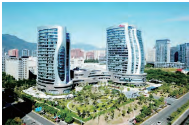
星网锐捷科技园三期荣获华东地区优质工程奖

推动生产管理数字化进程，不断完善和深化信息化应用，数字化日益转化为企业提质增效的强大动力。办公、财务、人力资源、工程项目管理等各业务模块信息互通、实时联动，搭建智慧工地管理平台，实现对施工现场“人、机、料、法、环”等关键要素管控和数据互联共享，进一步提升项目履约创效水平。2022 年集团有 5 个项目荣获省优质工程奖，其中 2 个项目荣获华东地区优质工程奖；有 7 个项目荣获市优质工程奖。1 个项目荣获国家级安全生产标准化优良项目，10 个项目荣获市级安全生产标准化优良项目。