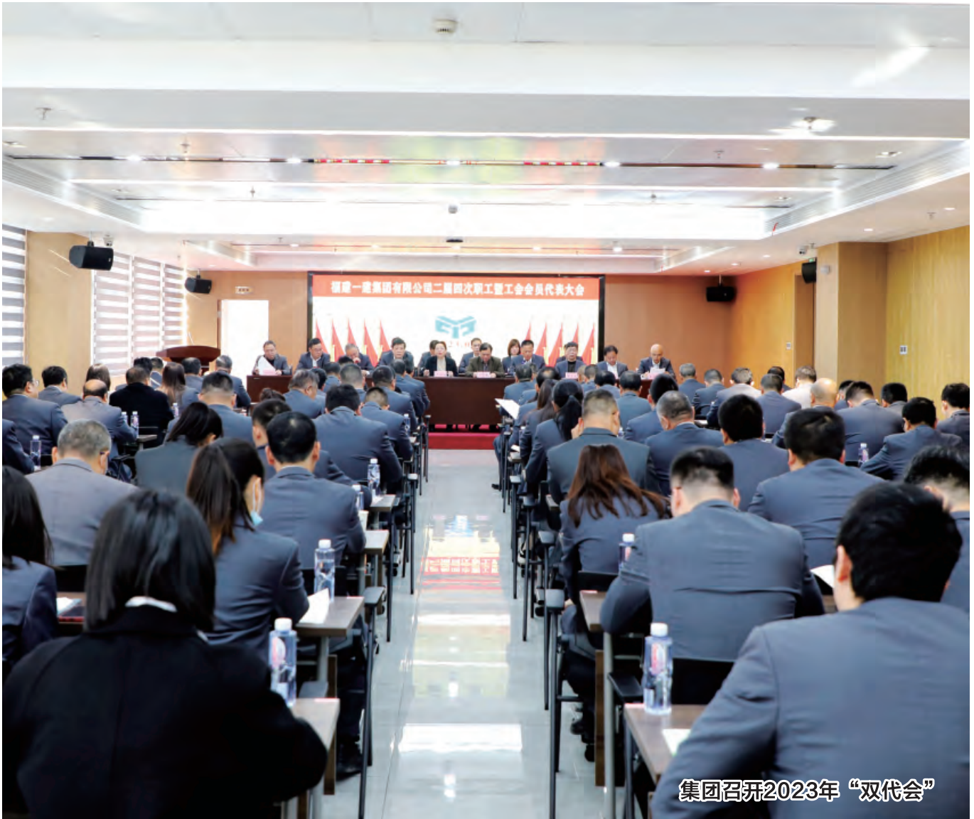
集团召开2023年“双代会”