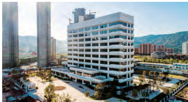
三明市疾病预防控制中心建设项目一期

工管控要点，规范施工细部做法，对现场施工进行技术交底和工法培训，保障了安全、质量和文明施工管理标准化。