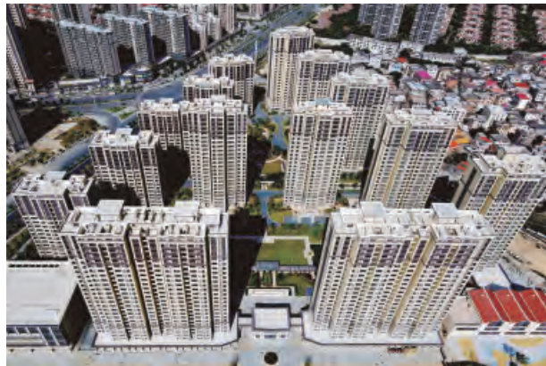
卓岐棚户区改造安居项目全景图

集团坚持“走出去”战略，全面构建良性业务发展格局，统筹推进区域经营工作，以干好项目为依托，打造精英团队为抓手，深入实施精细化管理，漳州区域市场规模持续扩大，发展势头强劲。