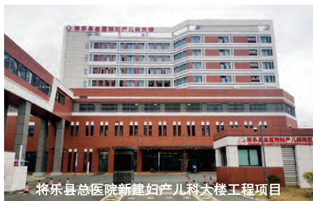
将乐县总医院新建妇产儿科大楼工程项目

本次 8 个获“瑞云杯”优质工程奖项目分别为三明市疾病预防控制中心建设项目一期、一建·锦绣家园-7#楼及整体地下室、将乐县总医院新建妇产儿科大楼工程项目、海翼·文璟院、一建·日月芳华、三明生态康养城服务中心建设项目、一建·西江悦、御景园二期—9#、10#、11#、12#、13#、15#楼及地下室。项目类型覆盖医院、办公楼、住宅楼、商业楼等多种公用、民用建筑类型，充分展现了集团在建筑行业较为突出建设实力和创优能力。