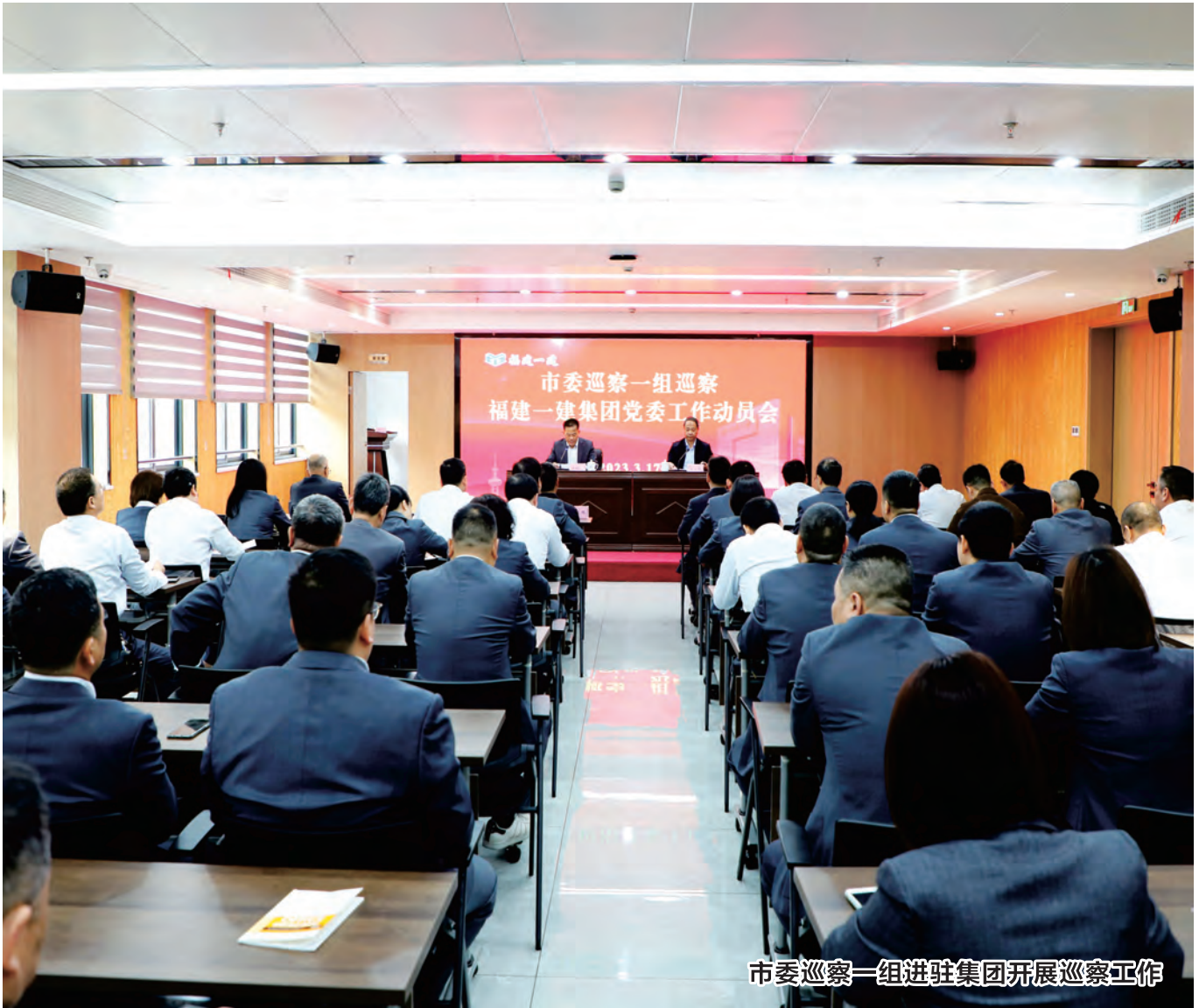
市委巡察一组进驻集团开展巡察工作